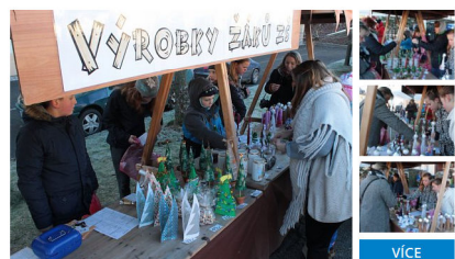
Mikulášské trhy v Kladrubech