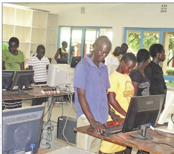
Ostrov Naděje na ostrově Rusinga uprostřed Viktoriina jezera v Keni začal vznikat v roce 2003.

Poté, co se ze sirotků rekrutovali školáci a byli vychovávaní 10 let v unikátním prostředí, kdy už v šesti letech mluví anglicky, nechtěli pracovníci poslat své žáky do internátních škol, kde v jedné místnosti spí i 150 dětí na palandách a v rámci výuky je